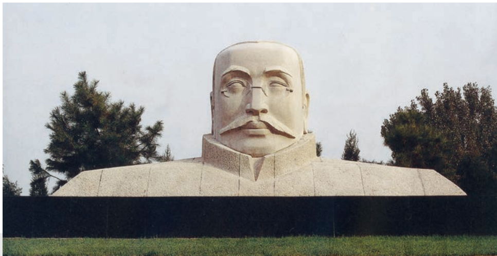
李大钊 花岗岩 高 400cm 1989 年 钱绍武 河北唐山

钱绍武所作的《李大钊》雕塑超越了传统写实主义艺术的形式，采用了夸张的艺术表现手法，使整座雕像坚如磐石，造型凝重，线条简练，气势磅礴。