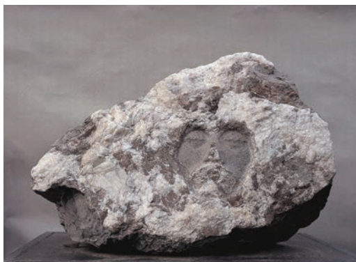
白山魂 火山岩 宽 94cm 1984 年 贺中令 中国美术馆藏

当雕塑材质的天然美与作品的艺术构思有机融合时，就能大大增加作品的审美价值。在火山岩上，用阴刻方式雕刻的《白山魂》使我们强烈地感受到长眠于白山黑水间的杨靖宇烈士悲壮的家国情怀。