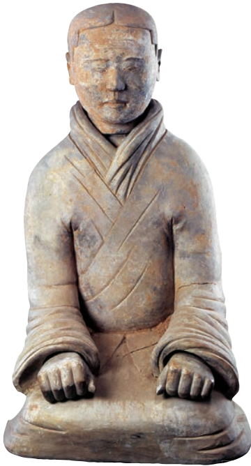
彩绘陶跽坐俑 陶 高100cm 秦 秦始皇帝博物院藏

圆雕是独立的、可以四面观赏的雕塑。圆雕主要通过自身的形象和与之相协调的环境构成统一的艺术效果，集中、简练、概括地表达主题思想以打动观众。如秦代的《彩绘陶跽坐俑》，它的四面都可以供人欣赏，并且每个角度都有不同的视觉效果。圆雕一般放置于可供四面观赏的环境中，也有出于宗教文化或环境限制等原因，只允许或要求从一个或某些固定角度进行观赏，如石窟和庙宇中的佛像、壁龛雕刻中的圆雕等。