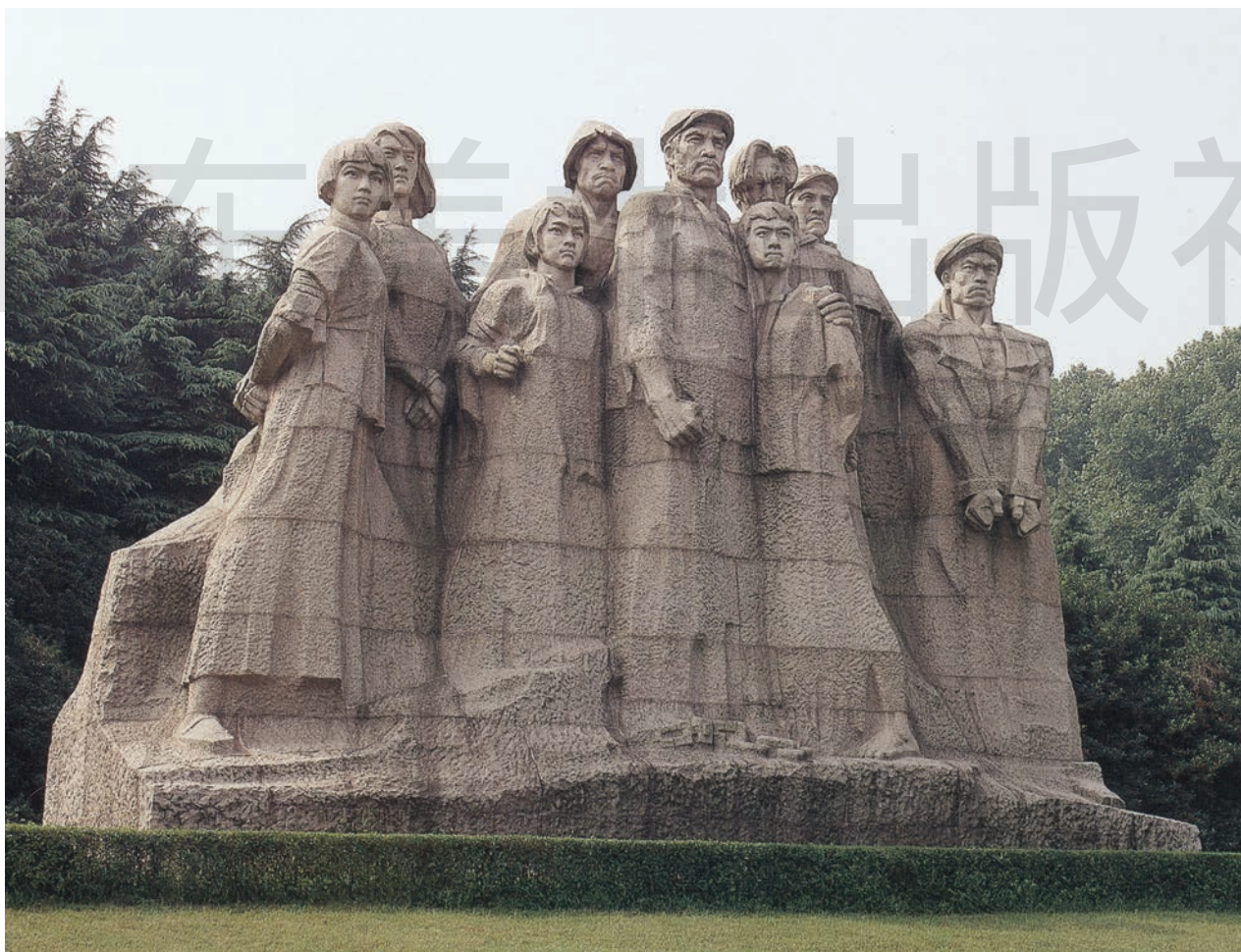
雨花台烈士就义群雕 花岗岩 高约 10m 1979 年 纪念碑创作组 江苏南京雨花台烈士陵园

雨花台烈士就义群雕由 179 块花岗岩拼装而成。花岗岩寓意永恒、坚固、沉重，雕塑家运用花岗岩的材料特点，将九位烈士就义前英勇不屈、视死如归的精神刻画得栩栩如生。群雕位于南京雨花台烈士陵园，与所处环境融为一体，共同向人们诉说着革命先烈们永垂不朽的精神。雕塑家们通过突出材质特点，使作品具有了特殊的感染力。