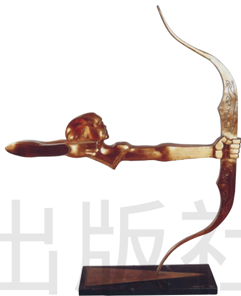
千钧一箭 铜 高 120cm 1985 年 朱成 瑞士洛桑国际奥林匹克博物馆藏