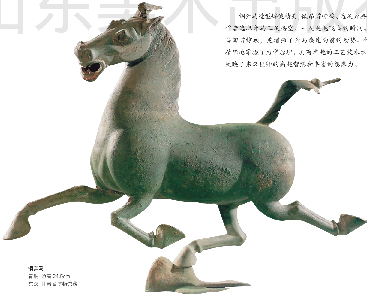
铜奔马 青铜 通高 34.5cm 东汉 甘肃省博物馆藏

铜奔马造型矫健精美，做昂首嘶鸣、逸足奔腾状。作者选取奔马三足腾空、一足超越飞鸟的瞬间。飞鸟回首惊顾，更增强了奔马疾速向前的动势。作品精确地掌握了力学原理，具有卓越的工艺技术水平，反映了东汉工匠的高超智慧和丰富的想象力。