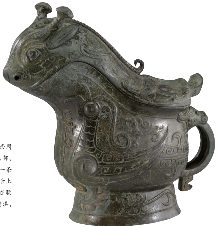
父乙觥 青铜 高 29.5cm 商 上海博物馆藏

觥是中国古代盛酒器，流行于商代晚期至西周早期。父乙觥的觥盖前端是一个想象中的动物头部，长着一对长颈鹿的角和兔子的耳朵，中脊浮雕一条细长小龙，盖后端是一只牛头，双角突出，长舌上翘，与器尾的牛头把手形成对应。凤鸟纹装饰在腹部、圈足、背上及器盖各部位。整件器物铸工精湛，纹饰华美。