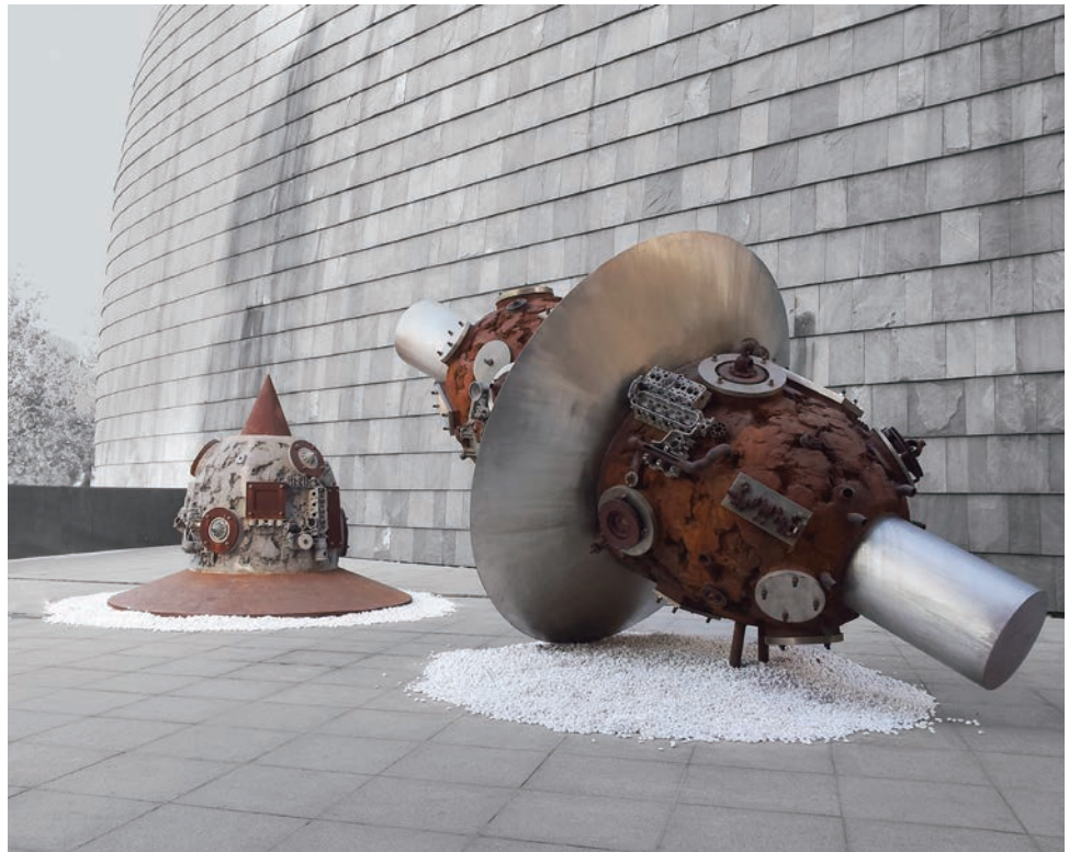
太空计划 金属 长约 500cm 2008 年 吕品昌 中央美术学院美术馆藏

观察本页的三件作品，分析一下，与传统雕塑相比，它们使用的材料和造型手法有什么不同。