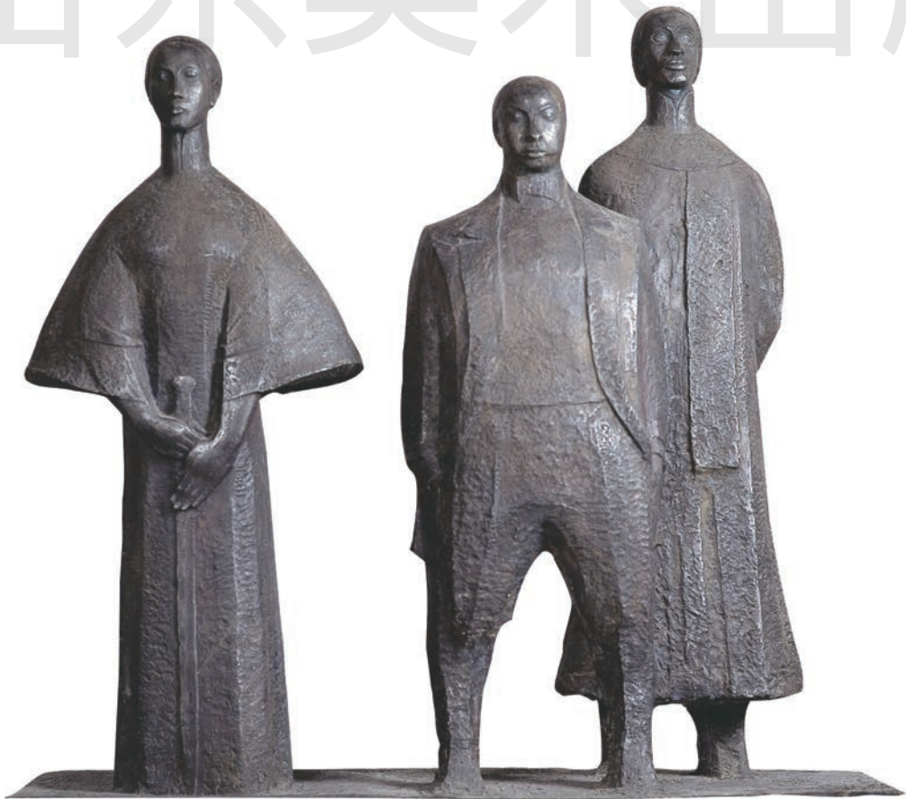
鉴湖三杰 玻璃钢 高 146cm 1989 年 曾成钢 中国美术馆藏

钱绍武所作的《李大钊》雕塑超越了传统写实主义艺术的形式，采用了夸张的艺术表现手法，使整座雕像坚如磐石，造型凝重，线条简练，气势磅礴。