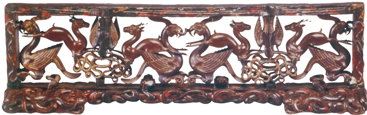
彩绘木雕小座屏 木 高 15cm 宽 51.8cm 厚 3cm 战国 湖北省博物馆藏

此透雕作品由一扁平的底座和长方形的屏面组成。屏面竖嵌屏座之上，镂空透雕的凤、鸾、鹿、蛇等多种动物呈各种姿态。座屏布局严谨，表现了鸟蛇搏斗、鸟胜蛇败的景象。各种动物均以黑漆为地，饰以朱红、灰绿、金银等漆的彩绘。