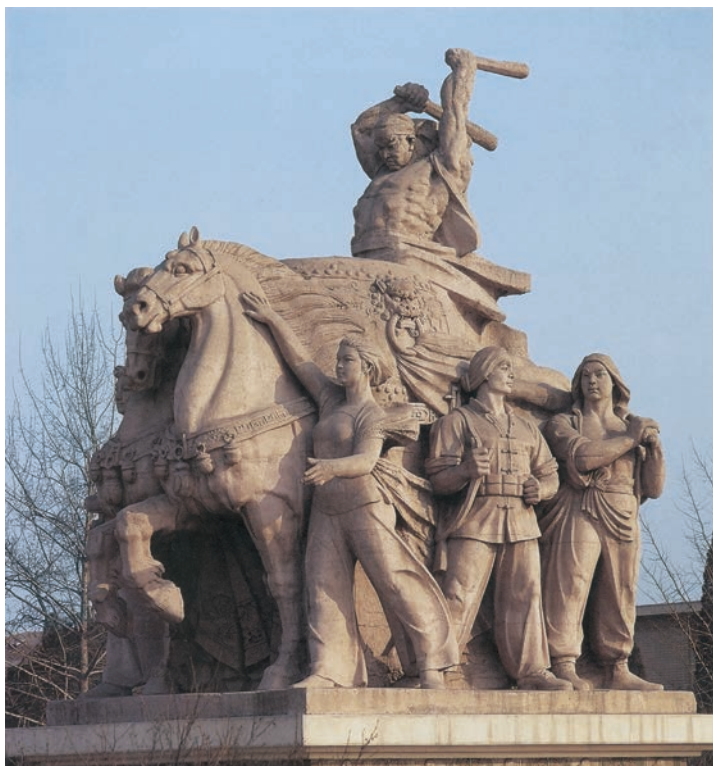
庆丰收 水泥 高 800cm 1959 年 鲁迅美术学院雕塑系 北京全国农业展览馆广场