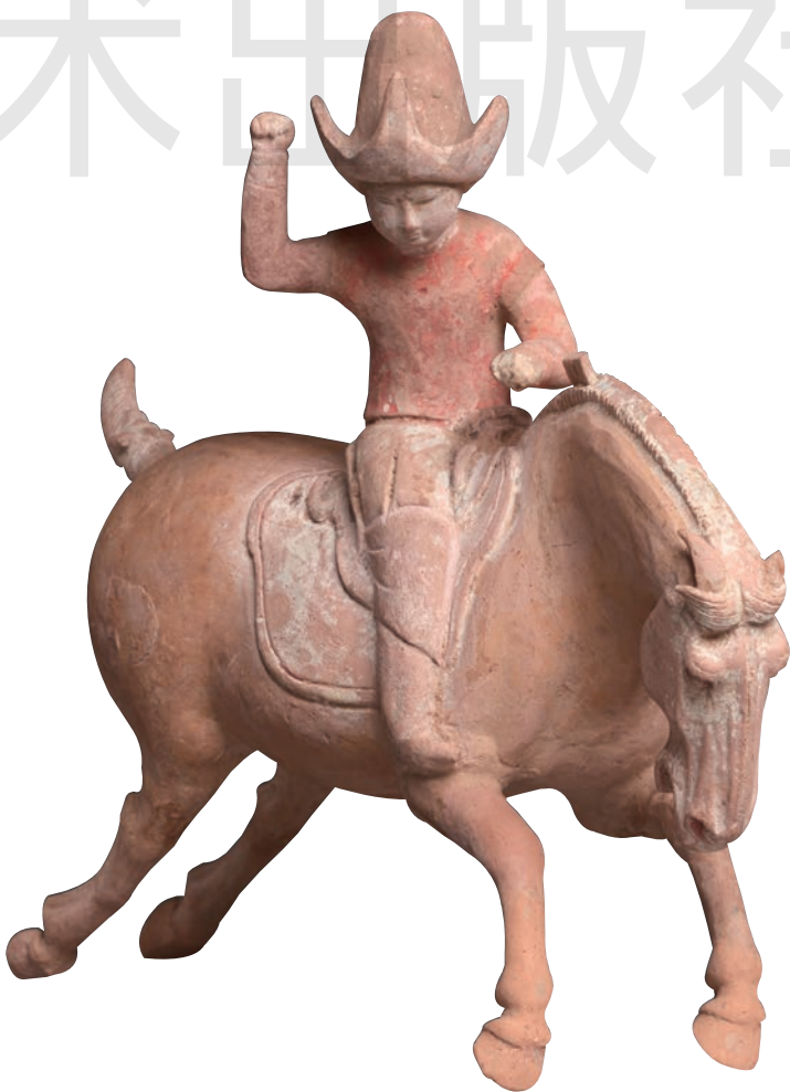
马球运动员 陶 高 31.2cm 唐 美国克利夫兰艺术博物馆藏