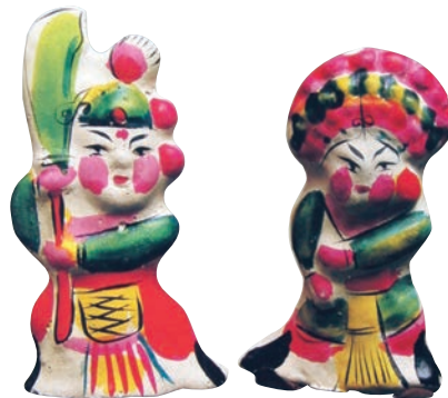
刀马人 泥 高 11cm 现代 河北玉田