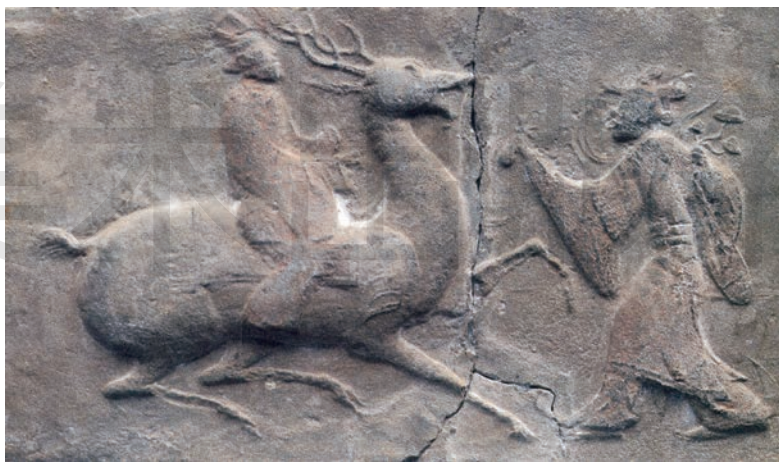
戏鹿画像砖 砖 高 25cm 宽 45cm 厚 5cm 东汉 四川成都新都区文物管理所藏

此画像砖的左方浮雕一男子，峨冠博带，骑鹿行进；鹿张口奋蹄，形体高大。右方浮雕一女子，头绾三髻，纤腰柔美，左手持花，右手持果，在鹿前做戏弄状。这件浮雕作品反映了东汉时期富贵之家的闲适生活。