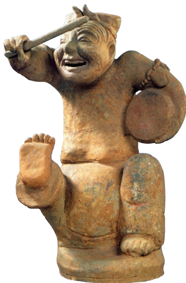
击鼓说唱俑 灰陶 高 56cm 东汉 中国国家博物馆藏

该头像额上堆塑半圆凸起的带状泥条，脸部圆润丰满并略加磨光，显得结实敦厚。五官部位妥帖，神情憨朴。艺术手法颇为洗练概括。