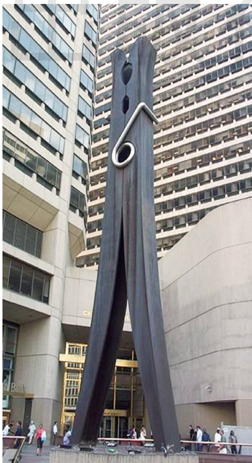
衣夹 瓦垅钢 高 13.72m 1976 年 [美国] 克雷斯·奥登伯格 美国费城中央广场