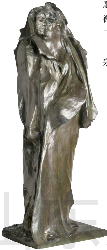
巴尔扎克 铜 高 106cm 1897 年 [法国] 罗丹 法国罗丹美术馆藏

按照作品题材内容的性质，雕塑分为人物雕塑、动物雕塑、肖像雕塑、宗教题材雕塑、历史题材雕塑、文学题材雕塑、纪念碑雕塑等。