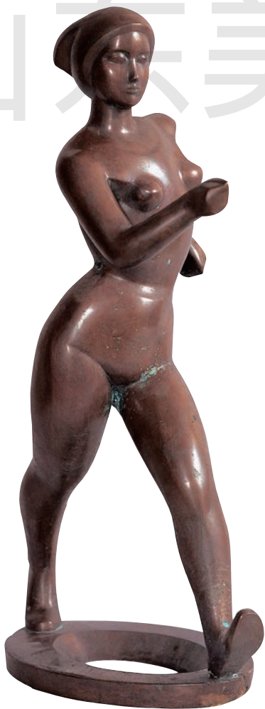
走向世界 铜 高60cm 1985年 田金铎 中国美术馆藏