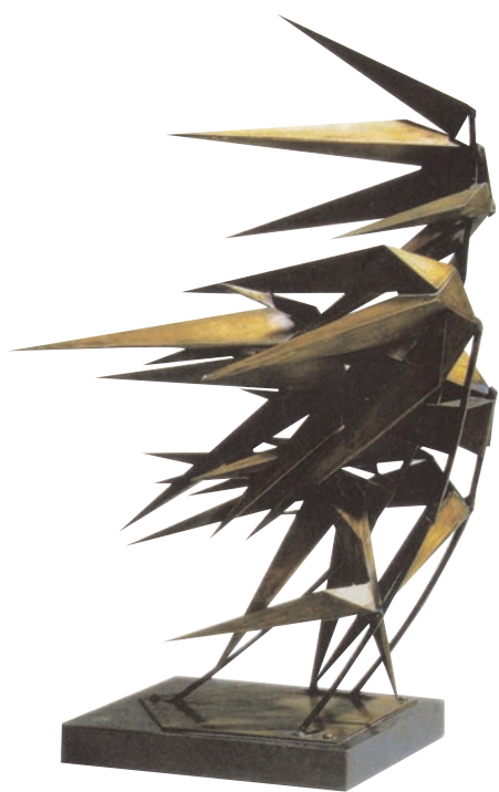
风竹 铜 高36cm 1979年 文杰 中国美术馆藏