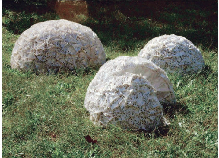
巢 棉线、竹篾、纸浆 高 60cm 1992~1993 年 施慧 中国美术馆藏