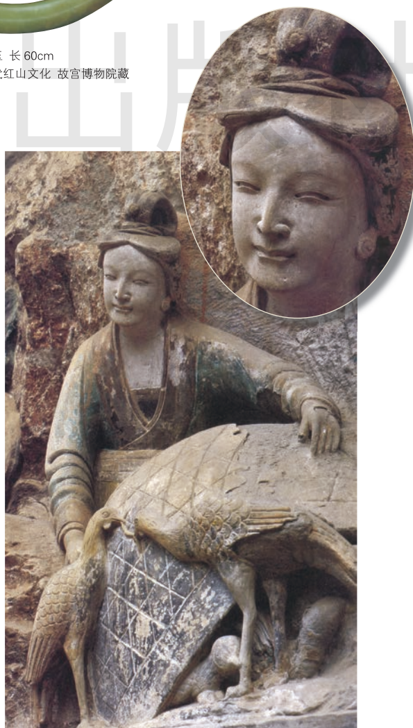
养鸡女 石 高 125cm 南宋 重庆大足宝顶山石窟