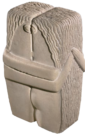
物 石灰石 高 58.4cm 1916 年 [罗马尼亚] 布朗库西 美国费城艺术博物馆藏

第三，雕塑所经常使用的石、木、土、金属等材料，具有鲜明的材质美特点。花岗岩的坚硬粗犷、大理石的细腻光滑、木料的丰富肌理、玻璃的晶莹剔透……雕塑的材质美与雕塑构思、造型艺术美的高度统一，是雕塑的又一重要特点。