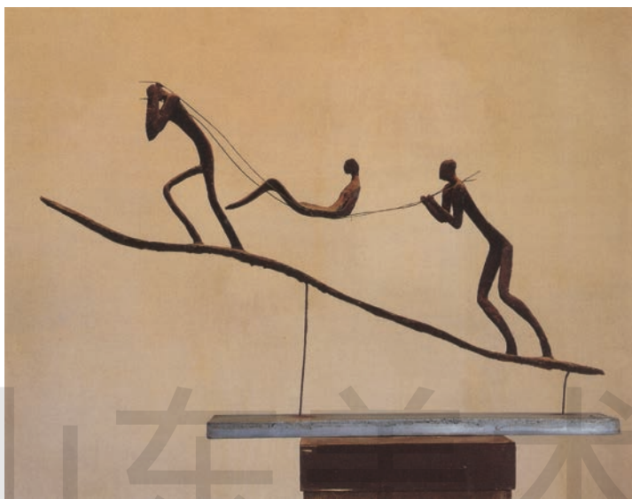
滑杆 玻璃钢 宽 100cm 1991 年 隆太成 四川美术学院藏

观察本页的四件作品，分析并判断，它们分别是用什么物质材料创作的？在作品与环境的关系中分别显示了什么功能和用途？