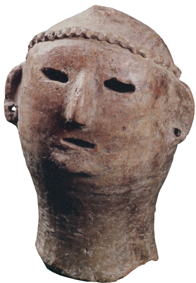
陶塑少女头像 红陶 高 12.5cm 新石器时代仰韶文化 甘肃省博物馆藏