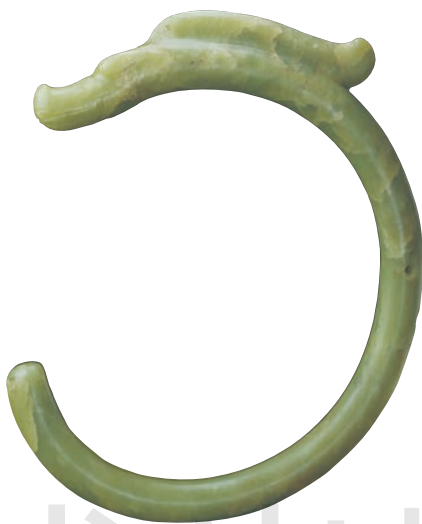
大玉龙 玉 长 60cm 新石器时代红山文化 故宫博物院藏