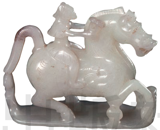
玉羽人飞马 羊脂玉 高 7cm 西汉 咸阳博物院藏

觥是中国古代盛酒器，流行于商代晚期至西周早期。父乙觥的觥盖前端是一个想象中的动物头部，长着一对长颈鹿的角和兔子的耳朵，中脊浮雕一条细长小龙，盖后端是一只牛头，双角突出，长舌上翘，与器尾的牛头把手形成对应。凤鸟纹装饰在腹部、圈足、背上及器盖各部位。整件器物铸工精湛，纹饰华美。