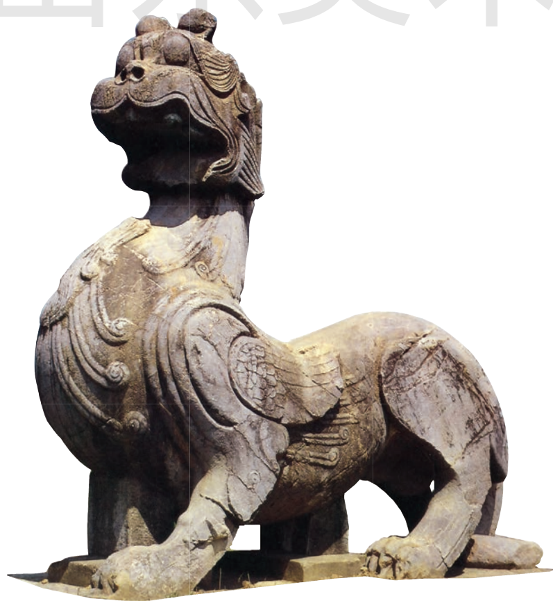
天禄 石 高 280cm 南朝梁 江苏丹阳