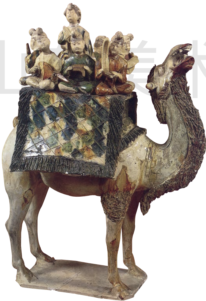
三彩骆驼载乐俑 三彩釉陶 高67cm 唐 陕西历史博物馆藏

2. 观看雕塑家工作的视频，或参观当地雕塑家、民间艺人的工作室，或请他们来学校讲解和演示雕塑创作过程，感受雕塑创作的工作环境与过程。