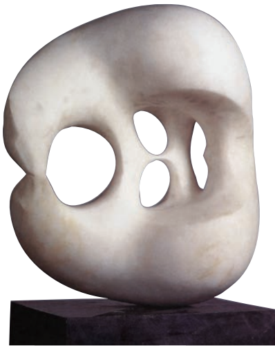
饮水的熊 大理石 高 60cm 1982 年 杨冬白 中国美术馆藏

20 世纪以来，雕塑的创作观念、造型手法与物质材料都发生了很大变化。雕塑家们有的使用玻璃钢、有机玻璃、纤维、织物等以前未曾尝试的新材料，有的用工业废料、日用生活品拼接、改装、组合成作品。同时也出现了软雕塑、动态雕塑、声光雕塑等传统雕塑所未有的新形态，使雕塑的物质材料、创作手法、风格样式更加丰富多样。