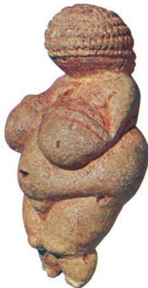
威伦道夫的维纳斯 石灰石 高 11.1cm 约前 25000 ~ 前 20000 年 奥地利维也纳自然史博物馆藏