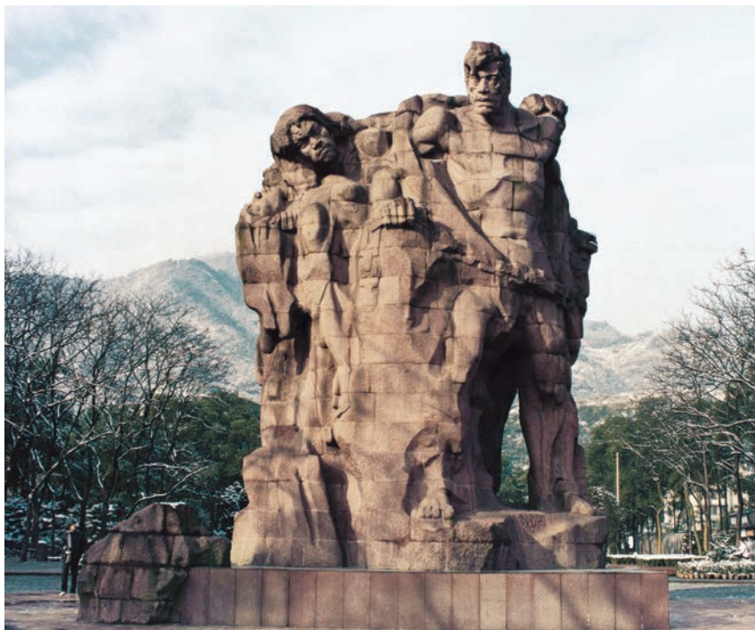
歌乐山革命烈士纪念碑 花岗岩 高约 10m 1979 年 江碧波、叶毓山 重庆歌乐山烈士陵园