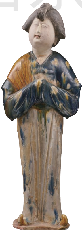
唐三彩女立俑 三彩釉陶 高44.5cm 唐 陕西历史博物馆藏

雕塑家利用了身体肌肉的形状和姿态，制造出强有力的冲突和对比。那只巨大、有力的手正要拉开弓弦，明显地透露出一股张力。这件雕塑作品展现出的强烈的动感和雄伟的气势，概括出埃米尔·安托万·布德尔追求不朽艺术的向往。