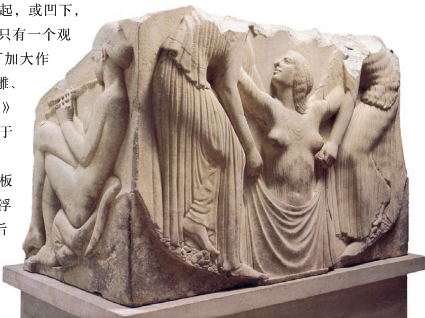
阿芙罗狄忒的诞生 大理石 高 107cm 约前 470 ~ 前 460 年 意大利罗马特美博物馆藏

透雕，又称为镂空雕，即将底板去掉，形成镂空的雕塑。透雕既有浮雕压缩空间的特点，又可以前、后两面进行欣赏。透雕往往刻镂精细，注重运用繁简对比形成生动效果，既可以独立作为观赏性的艺术品，又可以作为建筑、环境和日常生活用品的细节装饰，因而深受人们的喜爱。