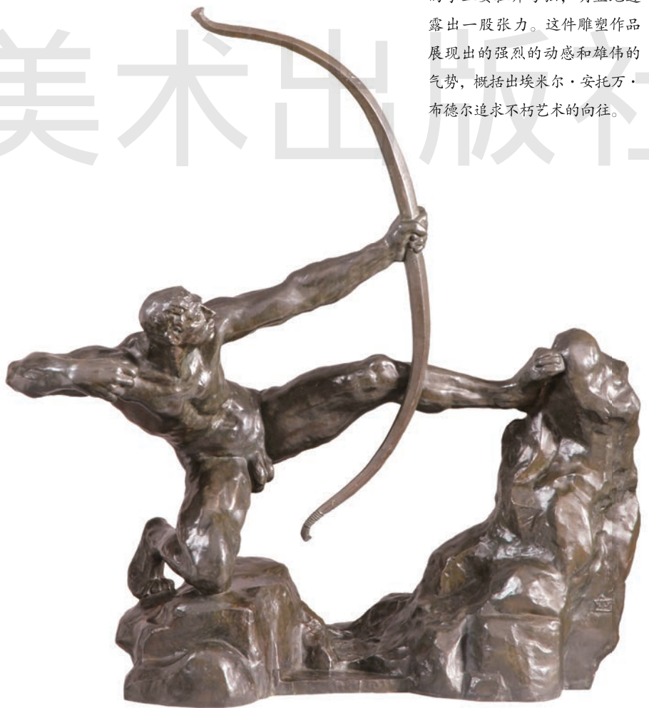
拉弓的赫拉克勒斯 青铜 高250cm 1909年 [法国] 埃米尔·安托万·布德尔 法国奥赛美术馆藏