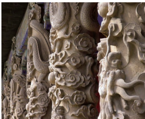
孔庙大成殿龙柱（局部） 石 明 山东曲阜