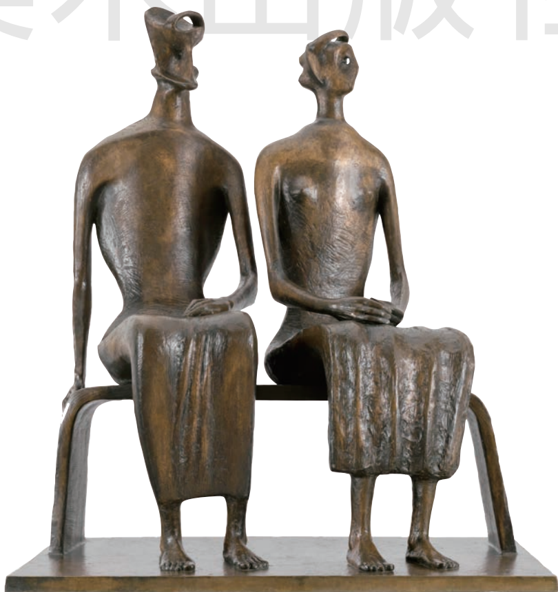
国王和王后 青铜 高161.3cm 1952~1953年 [英国] 亨利·摩尔 英国泰特现代美术馆藏