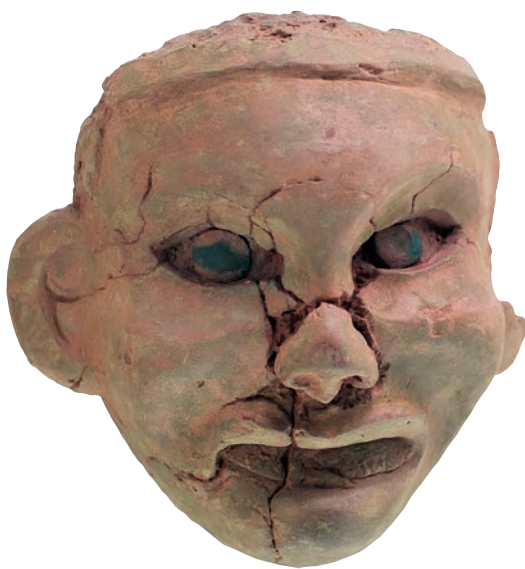
女神像 黄土 高 22.5cm 颜面宽 16.5cm 通耳宽 23.5cm 新石器时代红山文化 辽宁省文物考古研究所藏

《女神像》是新石器时代红山文化的雕塑佳作，相当于真人头部大小。塑像虽已残缺，但可以看出五官位置、比例相当准确，表情生动逼真。眼睛嵌淡青色圆形玉片，嘴部较长，双耳前有平齐的鬓角。从残断部分可知塑制的方法，内部用木柱做骨架，内胎用粗泥，外敷细泥。塑成后，表面打磨光滑，涂红彩，唇部涂朱，据此推测此塑像为一尊全身女像的头部。她是我们中华文明起源时期艺术高峰的标志之一，在中华文明史上具有极其重要的意义。