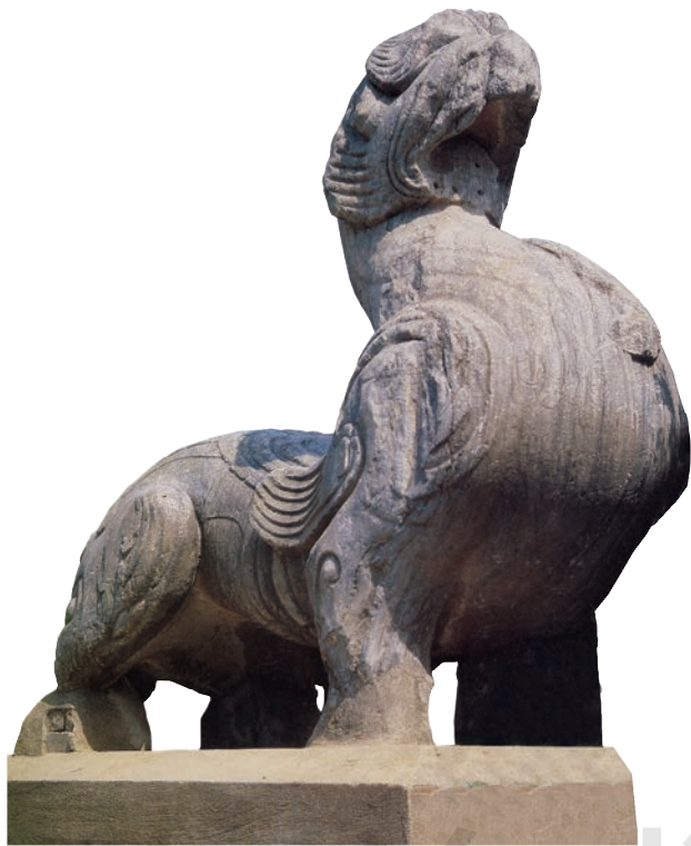
辟邪 石灰岩 高约 165cm 东汉 南阳汉画馆藏

中国雕塑的历史源远流长，内容丰富精深。陵墓雕塑、宗教雕塑、建筑和工艺装饰性雕塑遗存丰富，反映了古代中国人的审美观念、造型技艺和思想信仰。中国传统雕塑题材广泛，人物、动物、山水、故事、传说、生活场景等皆可作为表现内容。雕塑的物质材料涉及玉、石、泥、青铜、木、竹、果核、骨、牙等。中国雕塑丰富的社会功能性满足了不同时代人们的信仰、文化与社会仪式、生活审美等多方面的需求。