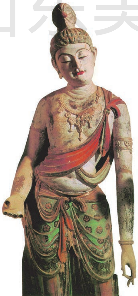
菩萨像（局部） 泥 唐 甘肃敦煌莫高窟第 45 窟