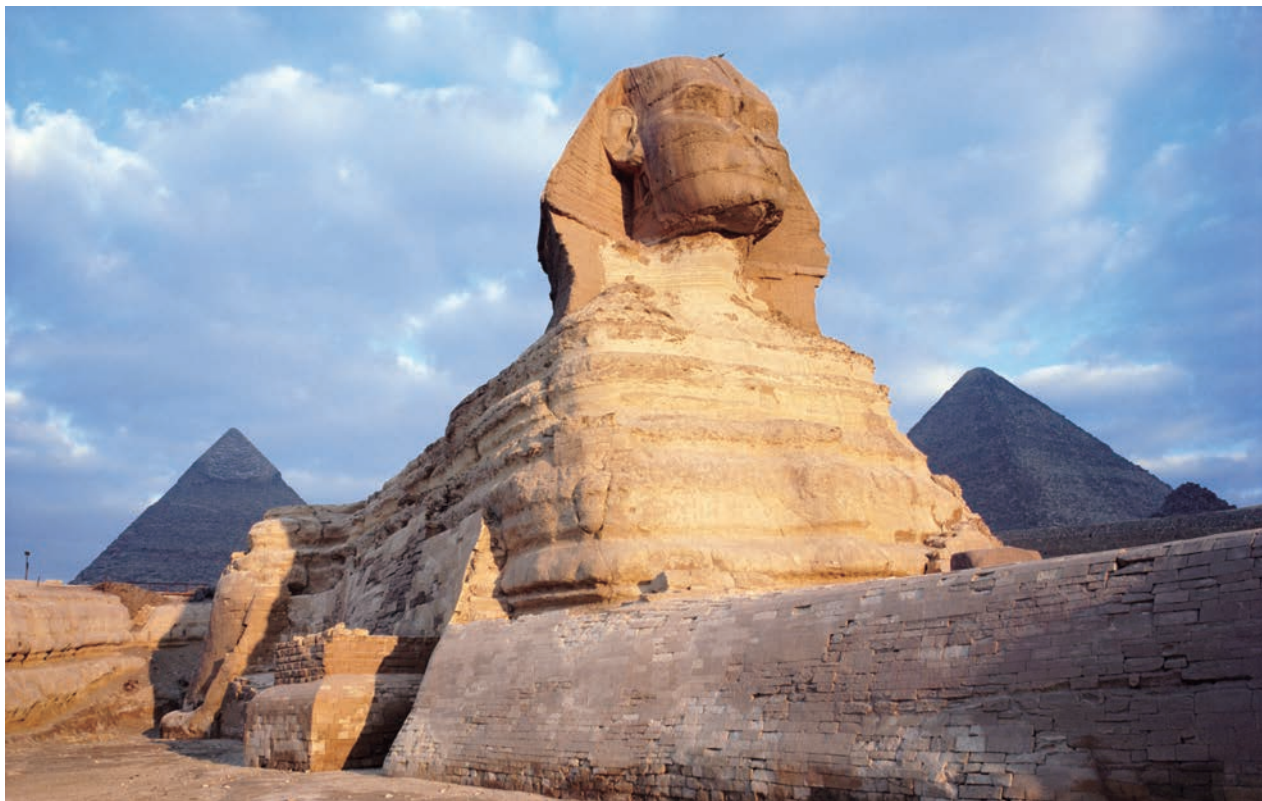
狮身人面像 石灰岩 高约 20m 约前 2500 年 埃及哈夫拉金字塔祭庙西北方

击鼓说唱俑踞坐于土台上，整个身体和头部微向右倾，头戴软小冠，并以长巾围绕一匝，前额上打一花结，在活泼诙谐的表演中透露出憨厚之态。此陶俑将民间说唱艺人兴高采烈、自我陶醉的神情刻画得惟妙惟肖，堪称东汉陶塑之杰作。