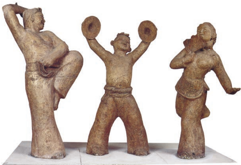
好喜欢 陶 通高 75cm 1989 年 卢波 中国美术馆藏