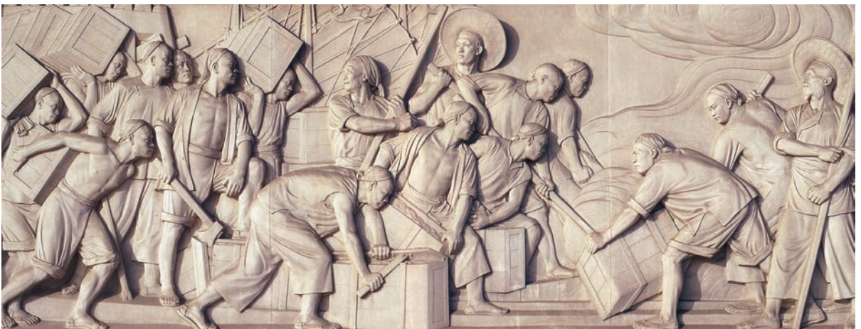
虎门销烟 汉白玉 高 200cm 1958 年 曾竹韶 天安门人民英雄纪念碑