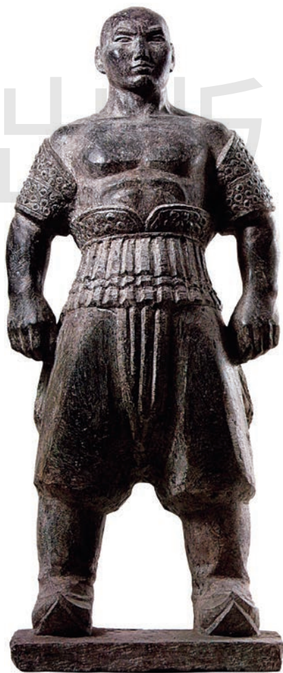
摔跤手 石 高82cm 1981年 刘焕章 中国美术馆藏