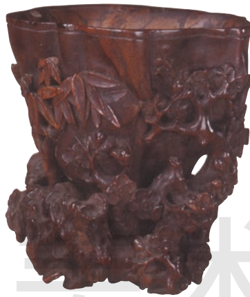
沉香木雕松竹梅笔筒 木 高 11.9cm 明 故宫博物院藏

明代中后期流行的沉香木雕文玩，令人赏心悦目。这件笔筒采用浮雕与透雕相结合的技法，构思奇巧，纹饰与筒身浑然一体，极富特色。