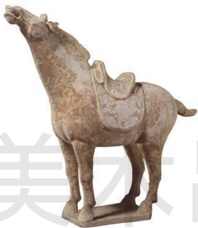
嘶马 陶 高 34.6cm 唐 陕西历史博物馆藏