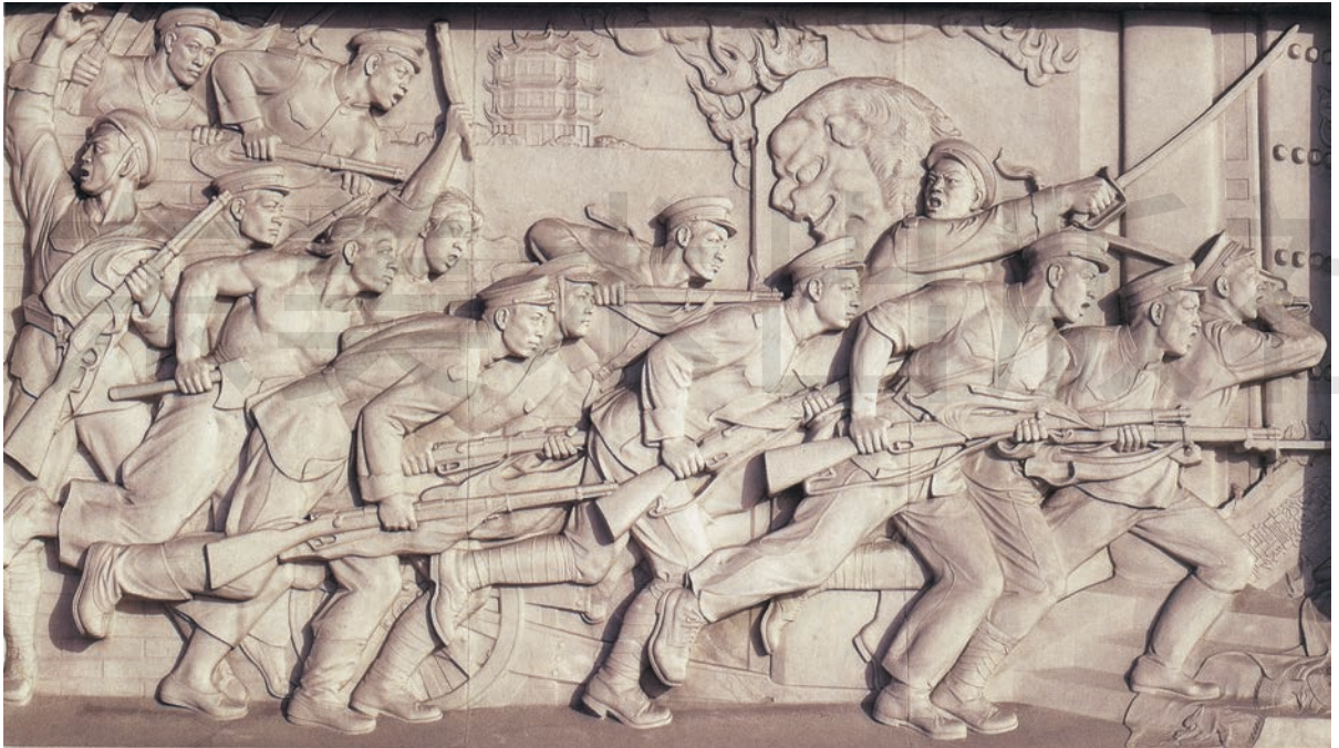
武昌起义 汉白玉 高 200cm 1958 年 傅天仇 天安门人民英雄纪念碑

1942 年，毛泽东同志《在延安文艺座谈会上的讲话》的发表，明确了文艺为革命的工农兵群众服务，人民生活是一切文学艺术的取之不尽、用之不竭的唯一的源泉等创作原则，引导与启发雕塑家们去创作与人民生活及社会历史密切相关的作品。1949 年 10 月 1 日，中华人民共和国的成立给中国现代雕塑的繁荣提供了历史机遇。人民英雄纪念碑浮雕既是这一时期的代表作品，又是时代主题与传统审美相结合的力作。