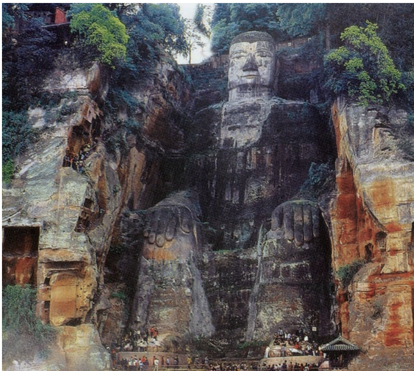
乐山大佛 石 高71m 唐 四川乐山

感”即形体的体积、材质的重量及硬度等给予观者的感受。例如,面对通高71米的乐山大佛时,我们会被其巨大的体量震撼;而把玩一个面塑人物时,我们也会因其小巧玲珑而爱不释手。体量的改变产生了截然不同的审美感受。形体不但占有空间,还以其特定的内在气势与力度影响着空间,从而在人的心理上产生超出其实际体量的或扩张,或收缩,或延伸,或扭曲,或挤压等视觉反应。