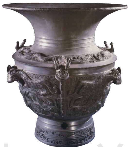
龙虎尊 青铜 高 50.5cm 商 中国国家博物馆藏

中国雕塑有着自己的艺术特质,传承了中国古代“形神兼备”的美学思想,讲究“以形写神”,强调艺术表现的写意性和造型的韵律感。中国传统雕塑善于将体块与线的造型结合,从材质自身的特点出发,智慧地进行构思与雕刻,产生了丰富的样式与经典作品,散发着独有的艺术魅力。